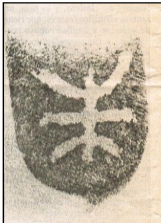
Sello utilizado por los presuntos extraterrestres en todos sus informes.

"Salvo estos puntos, no existen otros realmente originales en sus informes. "Creo que en lo demás nos han subestimado -comenta Ribera- por ejemplo, sus naves se basan en el principio magneto electrodinámico, que desde hace tiempo viene siendo experimentado por nuetsros científicos, quienes han dado un paso muy importante al conseguir neutralizar la onda de choque. Por otra parte -prosigue el conocido ovniólogo- la compañía americana Red Stone hace mucho tiempo que viene experimentando motores no clásicos, y es más, un famoso científico francés, que tiene un poderoso e ilimitado apoyo económico y cuyo nombre no estoy autorizado a decir, está construyendo una nave basándose en los planos ummitas."