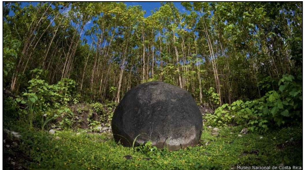
Museo Nacional de Costa Rica

Según la cosmogonía bribri -uno de los grupos étnicos más numerosos de Costa Rica- compartida por cabécares y otras etnias ancestrales de América, el dios del trueno Tara lanzaba estas esferas de piedra a los