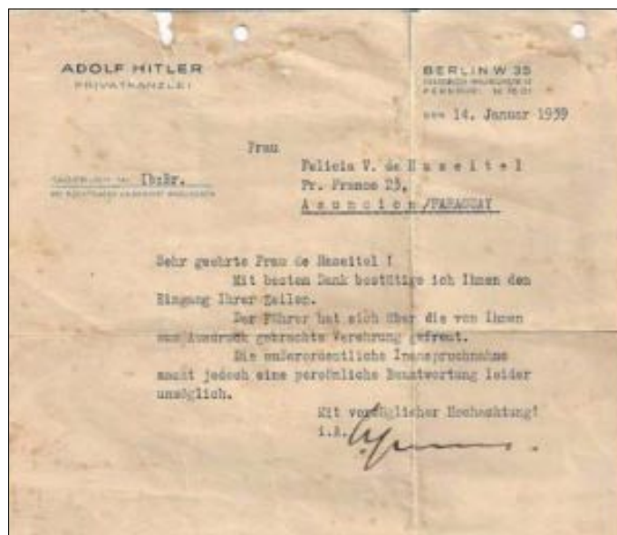
Carta oficial enviada a nombre de Hitler a una mujer residente en Paraguay, en 1939.